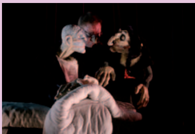
Molière © Carla Kogelman

spectacle en anglais // surtitrage français // durée 1 h en coréalisation avec la Ville de Gravelines