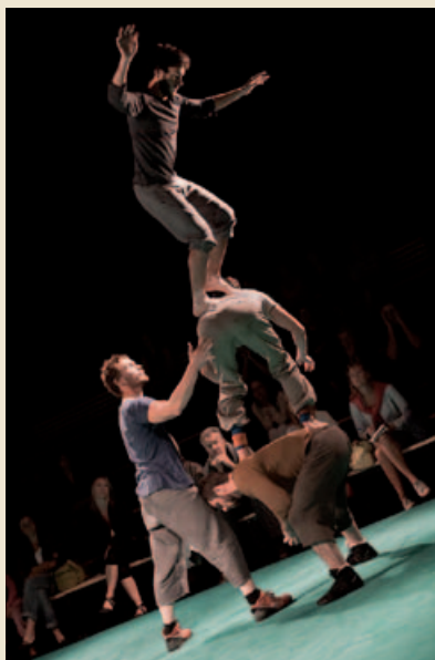
Face Nord