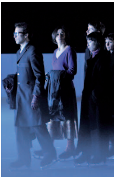
Migrations © Mikha Wajnrych