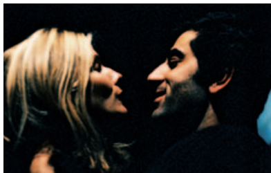
Oncle Vania

durée 2 h // en coréalisation avec la Ville de Loon-Plage